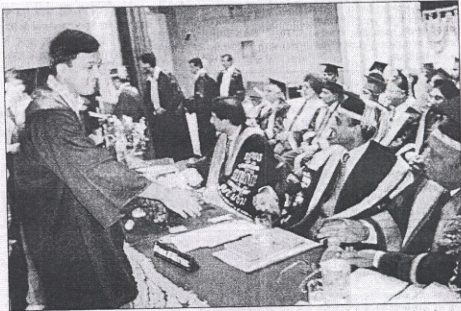
ਪਟਿਆਲਾ ਦੇ ਥਾਪਰ ਓਜੀਨਿਯਰਿੰਗ ਸੰਸਥਾਨ ਮੇਂ ਸ਼ੁਕਰਵਾਰ ਕੋ 18ਵੇਂ ਵੀਰਸ਼ਾਂਤ ਸਮਾਰੋਹ ਕੇ ਵੀਰਾਨ ਛਾਤ੍ਰੋਂ ਕੋ ਡਿਗ੍ਰਿਯਾਂ ਵਿਤਰਿਤ ਕਰਤੇ ਹੂਏ ਮੈਨੇਜਮੈਂਟ ਕੇ ਪਦਾਧਿਕਾਰੀ।

PUNJAB KESARI (PATIALA SUPP) OCT 9, 2004 PAGE 1