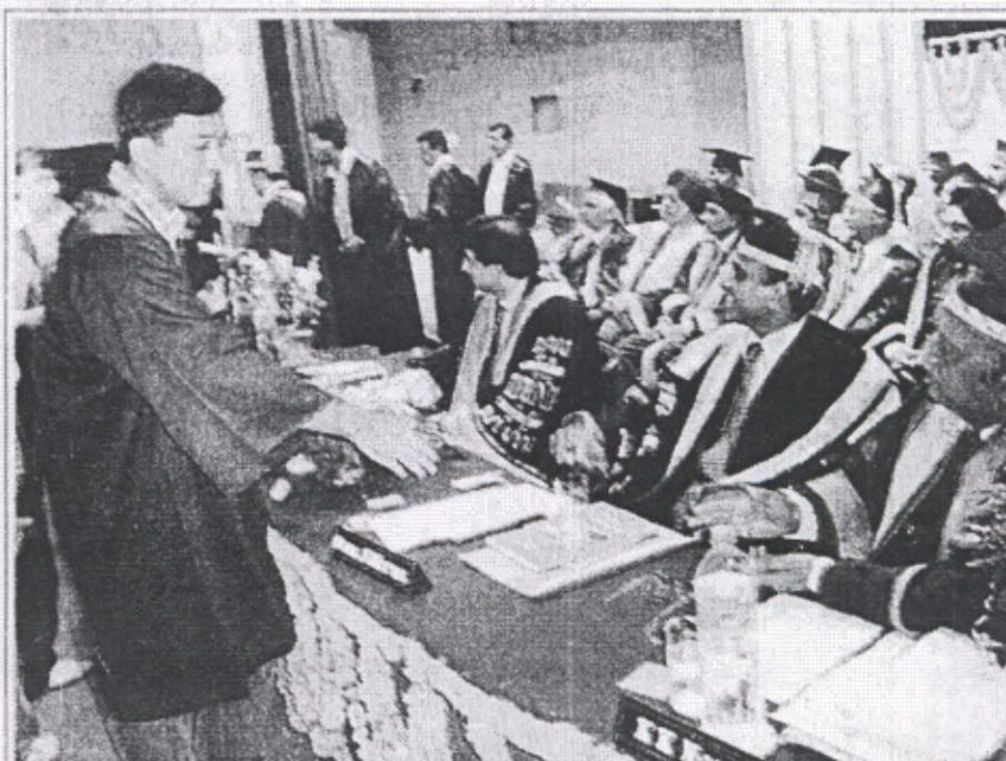
ਪਟਿਆਲਾ ਦੇ ਥਾਪਰ ਇੰਜੀਨੀਅਰਿੰਗ ਕੇਂਦਰ ਵਿਚ ਸ਼ੁਕਰਵਾਰ ਨੂੰ 18ਵੀਂ ਕਨਵੋਕੇਸ਼ਨ ਦੌਰਾਨ ਵਿਦਿਆਰਥੀਆਂ ਨੂੰ ਡਿਗ੍ਰੀਆਂ ਤਕਸੀਮ ਕਰਦੇ ਹੋਏ ਮੈਨੇਜਮੈਂਟ ਦੇ ਅਹੁਦੇਦਾਰ।

PUNJAB KESARI (PATIALA SUPP) OCT 9, 2004 PAGE 1