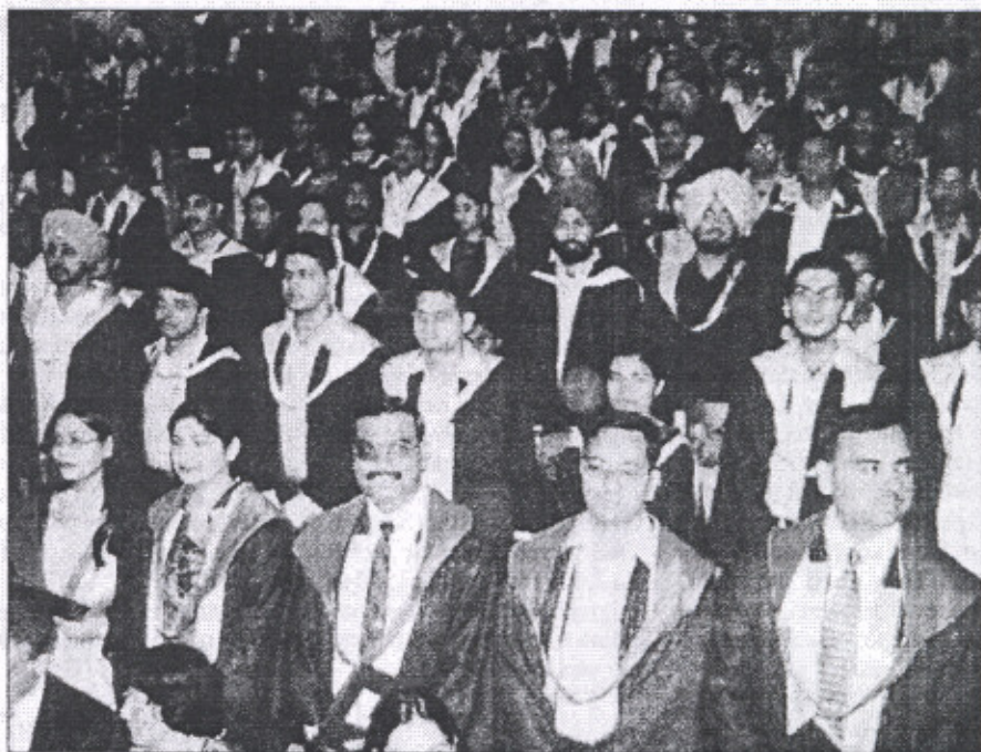
Students of the Thapar Institute of Engineering and Technology, Patiala, at the convocation on Friday. (Report on page 6)

THE TRIBUNE (CHANDIGARH SUPP) OCT 9, 2004, PAGE 1