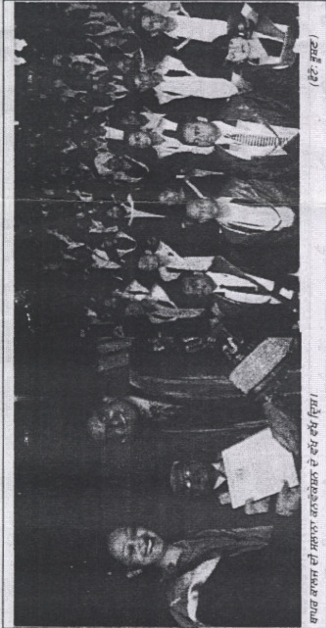
ਥਾਪਰ ਕਾਲਜ ਦੀ ਸਲਾਨਾ ਕਨਵੋਕੇਸ਼ਨ ਦੇ ਵੱਖ ਵੱਖ ਦਿਸ਼।