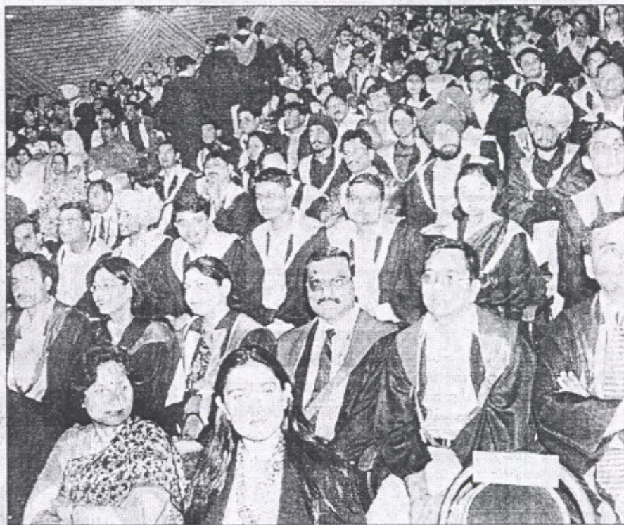
शुक्रवार को पटियाला के थापर इंस्टीट्यूट में आयोजित कन्वोकेशन के दौरान ऑडिटोरियम में मौजूद छात्र।