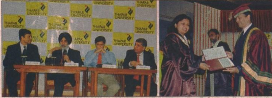
► थापर वि.वि. के दीक्षांत समारोह में डिग्रियां वितरित करने का दृश्य।