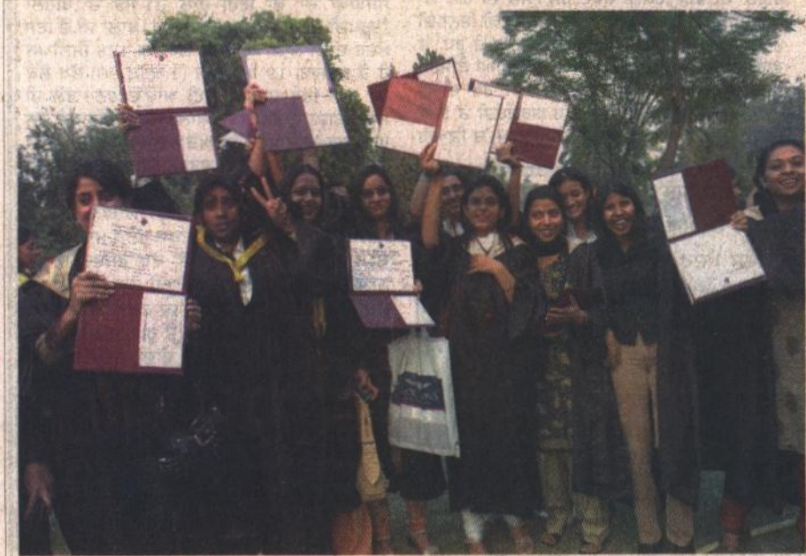
ਬਾਪਰ ਯੂਨੀਵਰਸਿਟੀ ਦੀਆਂ ਵਿਦਿਆਰਥਣਾਂ ਡਿਗਰੀਆਂ ਹਾਸਲ ਕਰਨ ਤੋਂ ਬਾਅਦ ਖੁਸ਼ੀ ਭਰੇ ਰੋਅ 'ਚ।