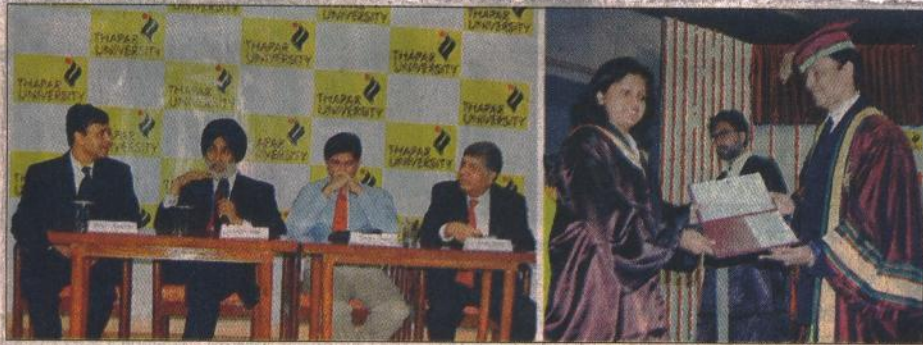
ਬਾਪਰ ਯੂਨੀ. ਦੀ ਕਨਵੋਕੇਸ਼ਨ 'ਚ ਡਿਗਰੀਆਂ ਵੰਡੇ ਜਾਣ ਦਾ ਦ੍ਰਿਸ਼। ..... (ਦਿੱਤੇ: ਸੁਦਰ)