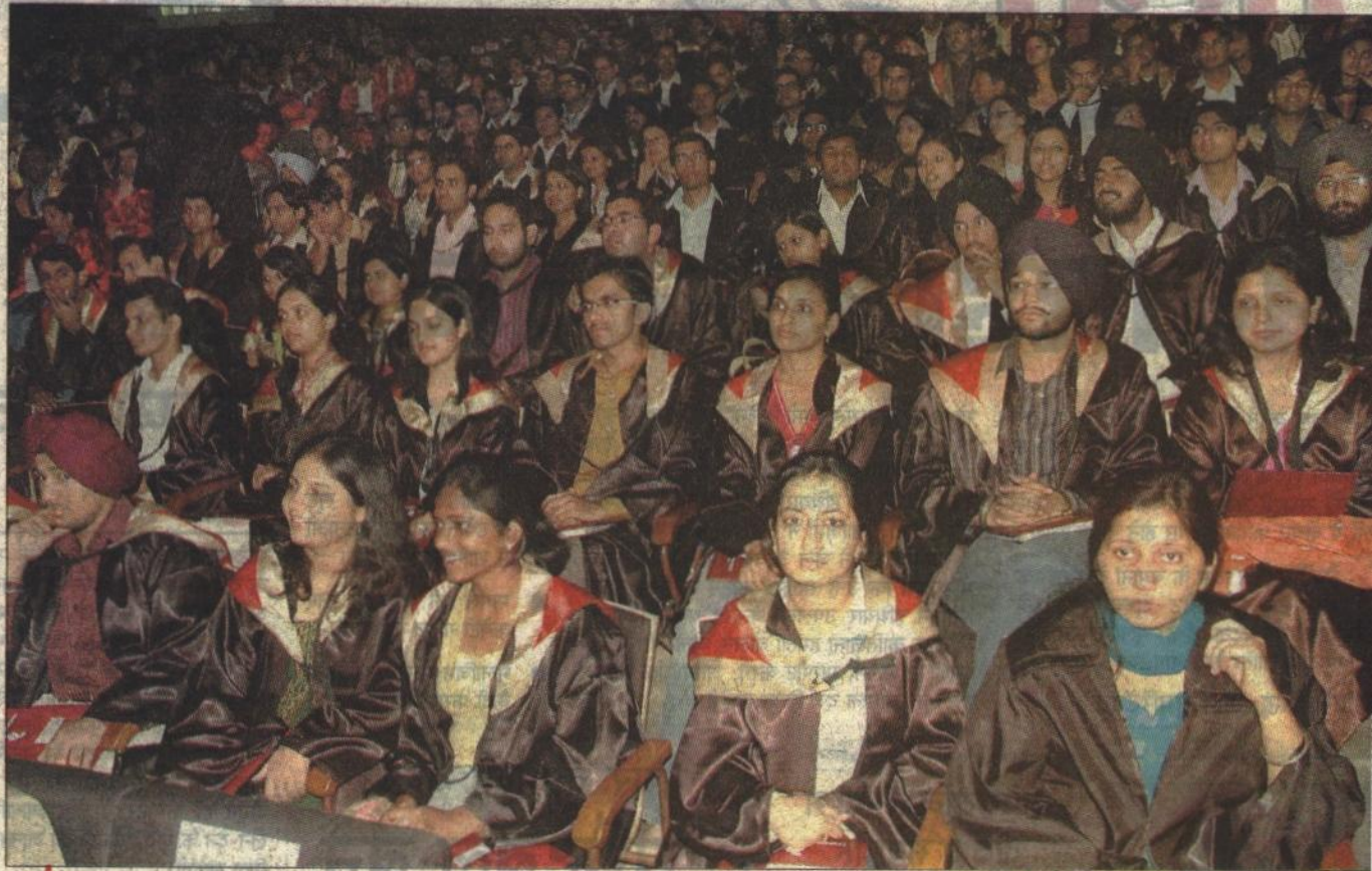
उत्सुकता : सोमवार को पटियाला की थापर यूनिवर्सिटी में आयोजित दीक्षांत समारोह में भाग लेते विद्यार्थी।